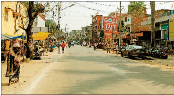
बैकुंठपुर का मुख्य मार्ग जहां होना है चौड़ीकरण

बैकुंठपुर। शहर से गुजरने वाले मुख्य मार्ग के चौड़ीकरण की हलचल फिर शुरू हो गई है, इसके लिए करोड़ों की राशि स्वीकृति के लिए प्रस्तावित की गई है, इसके बजट में स्वीकृति होने के बाद टेंडर प्रक्रिया पूरी कर समय-समय में मुख्य मार्ग का चौड़ीकरण कार्य पूरा कर लिया जाएगा।